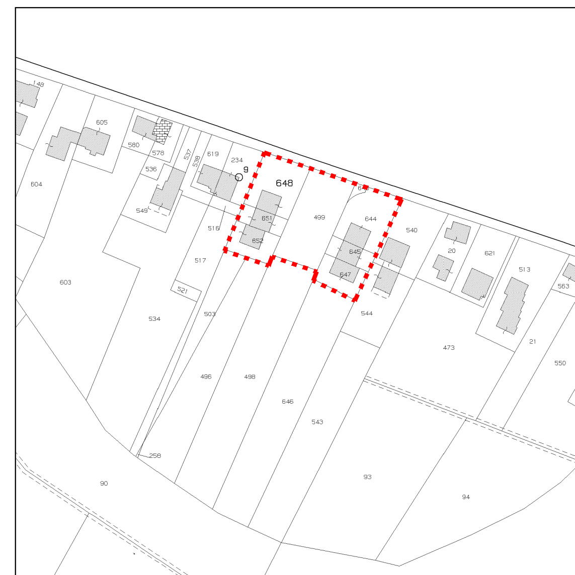
ESTRATTO DI MAPPA scala 1:2000